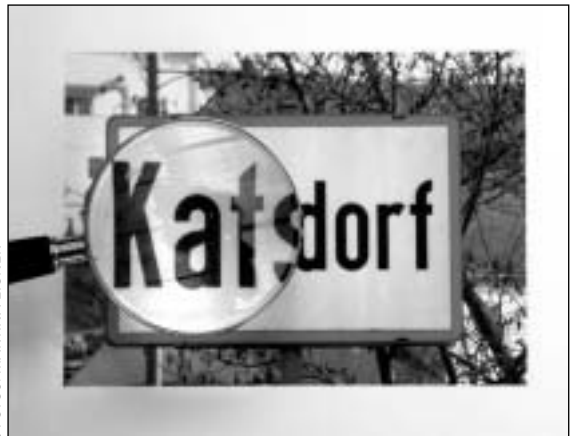
3 FOTOS: MARTINA EIGNER

Bei der Dichte und Vielfalt des Programmes ist es ratsam, wie ein Scheinwerfer, der Dinge und Vorgänge ganz deutlich hervorhebt und gleichzeitig andere verblassen lässt, seine Aufmerksamkeit auf das ihm Wesentliche zu richten.