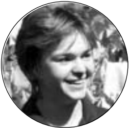
Eine Recherche von Irene Kopf

Seit der Strommarktliberalisierung (1. Oktober 2001) können alle StromkundInnen ihren Stromversorger frei wählen . Doch nicht einmal 2 % der PrivatkundInnen haben von ihrem neuen Recht Gebrauch gemacht und haben gewechselt.